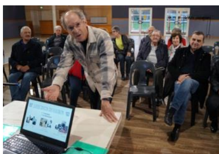
À Saint-Hilaire comme à Agen : peu de monde mais des échanges passionnants.

Ce fut un test... et une déception, puisque, malgré une bonne promotion auprès de gens censés s'intéresser au monde de l'image et du cinéma, nous n'avons touché qu'une petite cinquantaine de personnes. Nous insisterons et relancerons municipalités et cinémas.